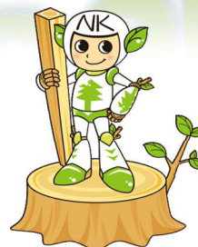
ナカモクキャラクター なかもくくん

こんにちは。御前崎市のナカモクです。 工務店様の家づくりのパートナーとして、 お客様に満足して頂ける家づくりを支援させて頂くため 数々の最新情報をお知らせいたします。