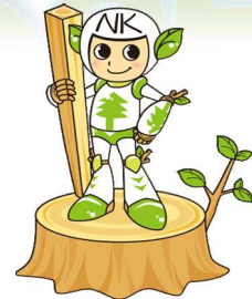
ナカモクキャラクター なかもくくん

こんにちは。御前崎市のナカモクです。 工務店様の家づくりのパートナーとして、 お客様に満足して頂ける家づくりを支援させて頂くため 数々の最新情報をお知らせいたします。